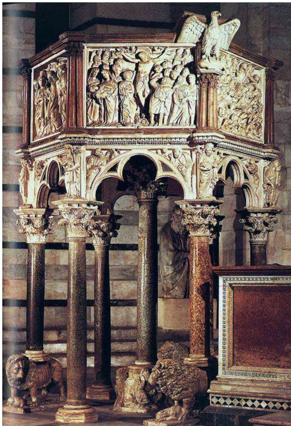
Кафедра баптистерия в Пизе.

пройдет несколько веков, пока средневековую схематичность, нарочитую упрощенность сменит гуманизм и достоверность Возрождения.