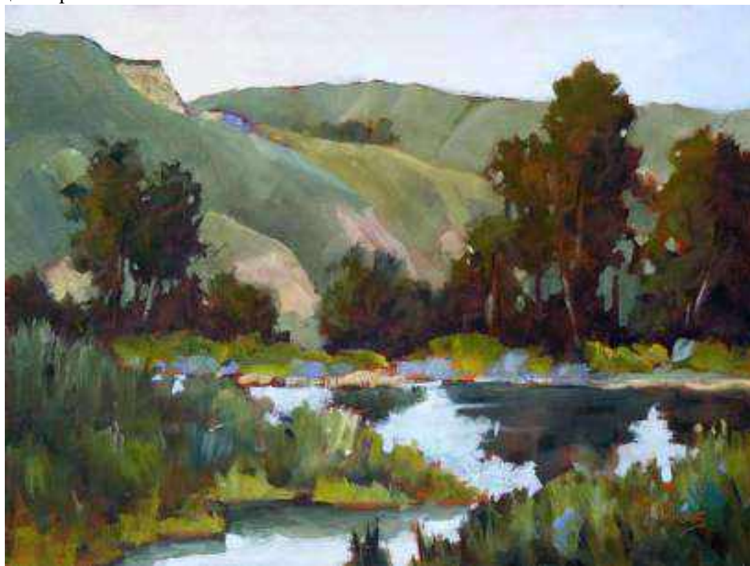
Пленэр. Этюд маслом

Для создания красочных и реалистичных картин на тему окружающей природы художникам приходилось выезжать далеко за пределы своего дома. На натуре живописцы чаще всего делали только наброски или этюды с изображением основной композиции будущей картины.