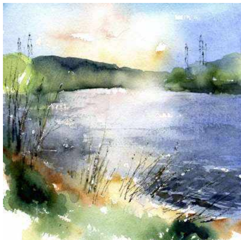
Пленэр. Акварельный этюд