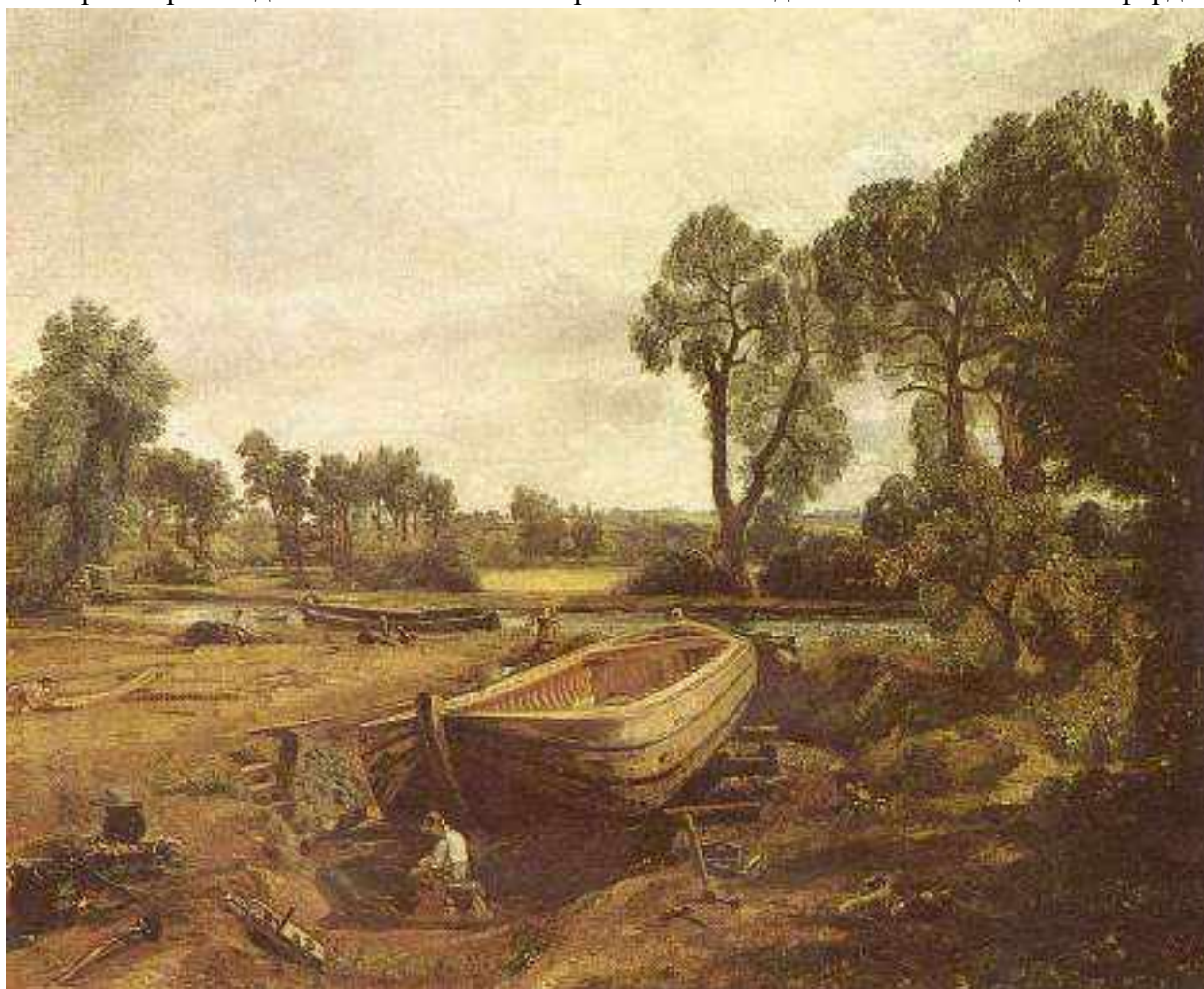
Пленэр. Джон Констебль. Строительство лодки возле мельницы Флэтфорд. 1815

Они осмелились пойти против устоявшихся традиций и решились от начала до конца писать картины на открытом воздухе. 1815 годом датировано первое полноценное пленэрное произведение Констебля — «Строительство лодки возле мельницы Флэтфорд».