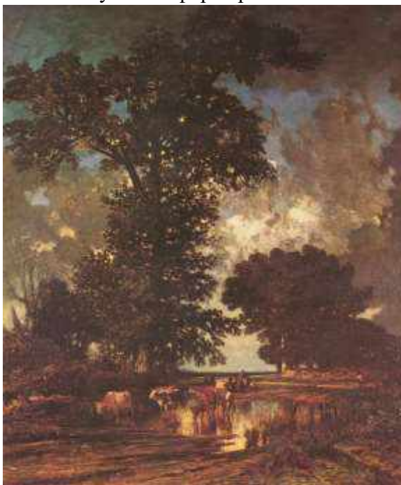
Пленэр. Жюль Дюпре. Лужа под дубом. 1850

История пленэра насчитывает чуть более 200 лет, но его истоки уходят корнями еще в начало эпохи Раннего Возрождения — в первую половину XV века. Именно в то время в европейском изобразительном искусстве сформировался пейзажный жанр.