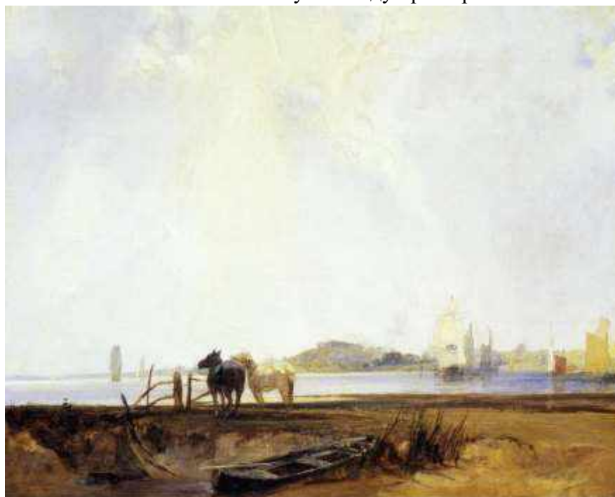
Пленэр. Ричард Паркс Бонингтон. Пейзаж близ Кильебофа. 1825

Пленэр — достаточно сложная в исполнении техника для начинающих живописцев. При написании картины на открытом воздухе постоянно меняется окружающая световоздушная среда, появляются и исчезают всевозможные цветовые оттенки. Особенно заметным это становится в солнечную погоду при переменной облачности.