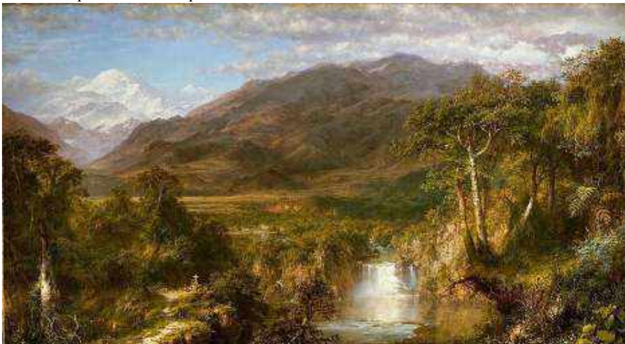
Пленэр. Фредерик Эдвин Черч. Сердце Анд. 1859

По возвращении домой художник продолжал работу над произведением уже в условиях мастерской. Здесь он по памяти и на основе ранее созданных набросков в течение длительного времени писал картину. Такая традиция просуществовала около 300 лет, до появления романтизма в европейской живописи.