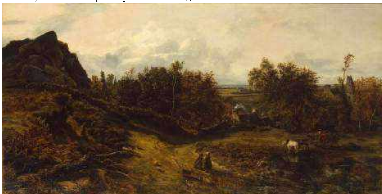
Пленэр. Теодор Руссо. Вид в окрестностях Гранвиля. 1833

Художник может писать картины на пленэре различными видами красок: масляными, акварельными, акриловыми или гуашью. Но для того, чтобы идеально передать все богатство природы при естественном освещении, ему приходится учитывать многие нюансы, в том числе время суток и сезон года.