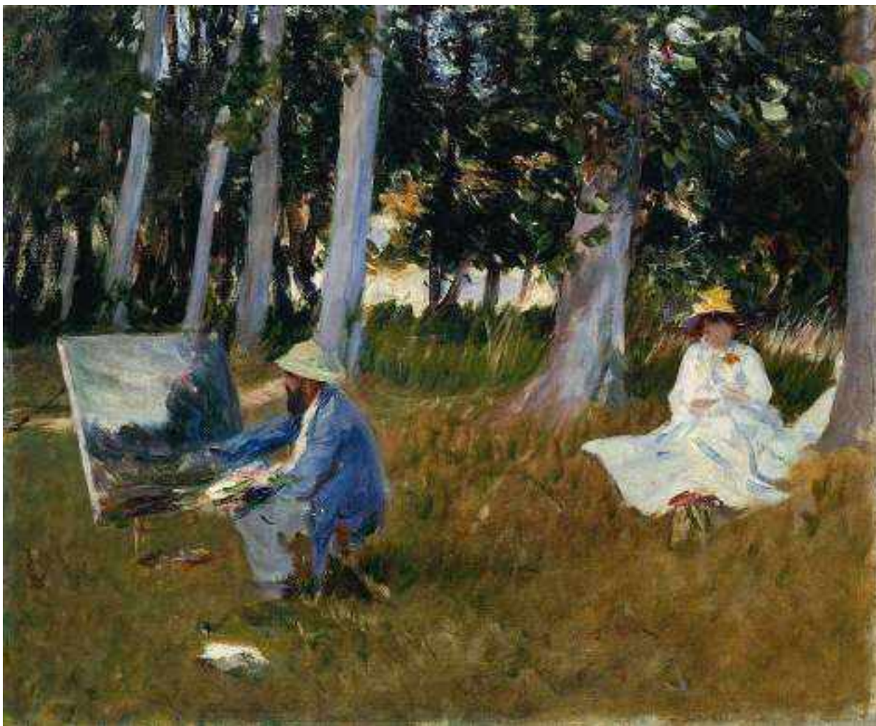
Пленэр. Джон Сингер Сарджент. Клод Моне, рисующий на опушке леса. 1885

Пленэр (от французского plein air — «открытый воздух») — это техника написания картин вне мастерской, на природе, при естественном освещении. Пленэр, в отличие от традиционной студийной живописи, позволяет художнику с большой точностью отобразить на холсте или бумаге богатство окружающих красок и малейших изменений цвета природы.