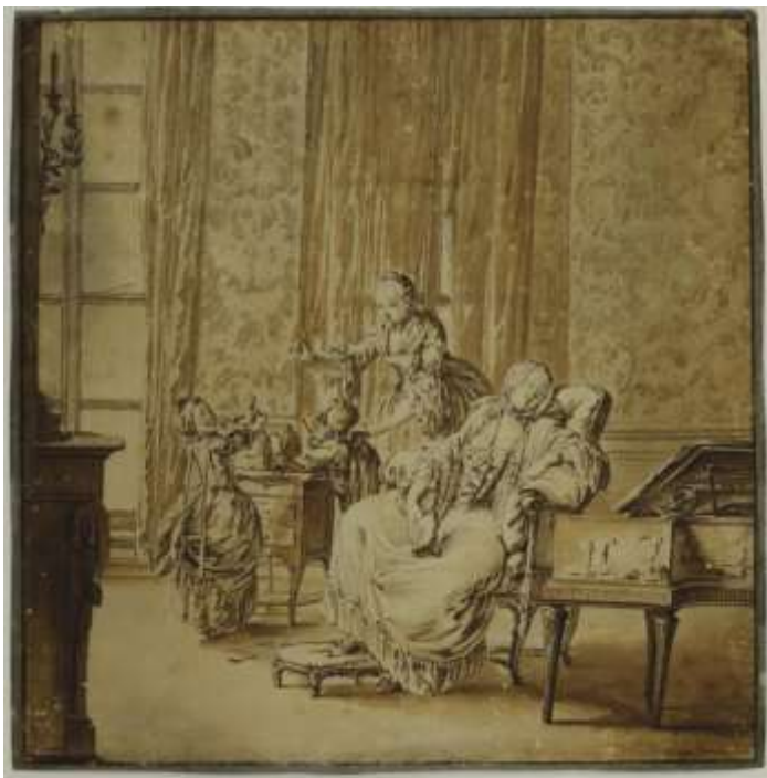
Жан Мишель Моро Младший. Отдых молодой матери. 1762