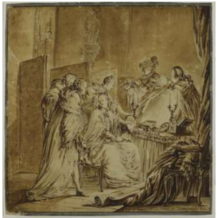
Жан Мишель Моро Младший Туалет перед маскарадом. 1762