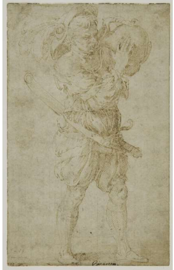
Пармиджанино (Франческо Маццола). Ландскнехт, пьющий из кувшина 1530 – 1540г.