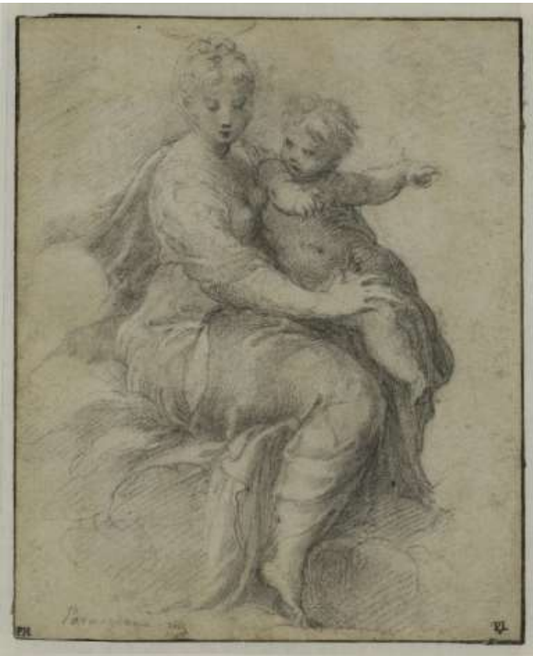
Пармиджанино (Франческо Маццола). Мадонна с младенцем в облаках 1524 – 1527г.