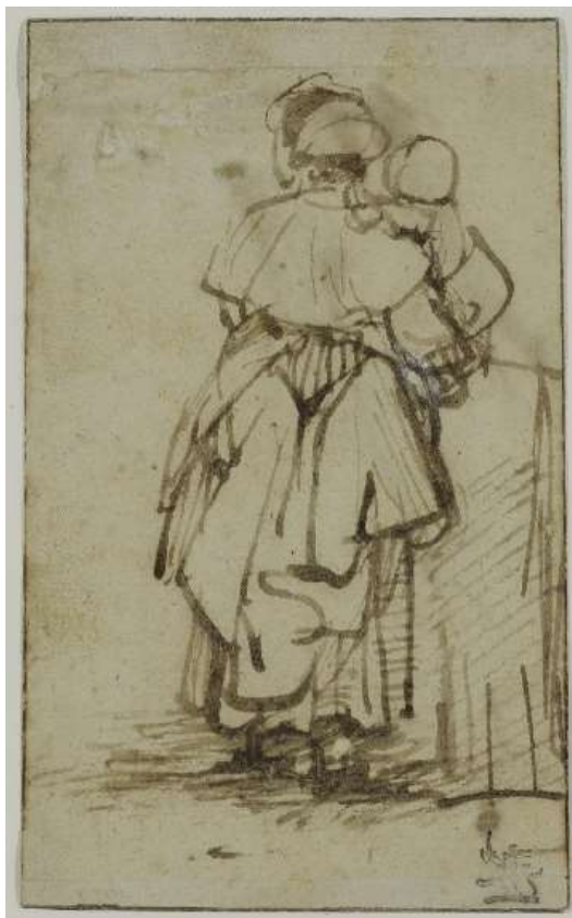
Рембранд Харменс Ван Рейн. Набросок женщины с ребенком на руках. Рубеж 1640 – 1650-х