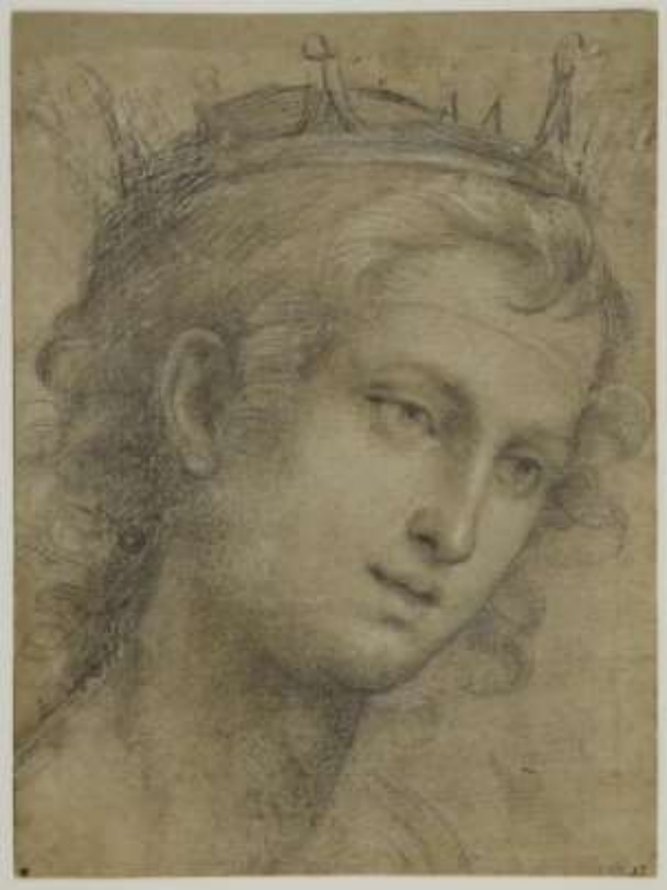
Джованни Антонио Сольяни.