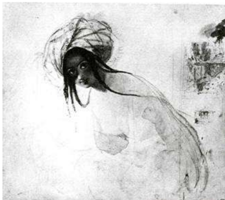
К. Брюлов. Турчанка. Акварель

Все разновидности технических приемов рисунка, дошедшие до нашего времени в основном сложились в эпоху Возрождения в Италии. Уже тогда в рисунке применялись свинцовые, серебряные и другие металлические грифели (штифты), графит, итальянский карандаш, сангина, уголь, мел, пастель, а также жидкие материалы – бистр, тушь, разноцветные чернила, акварель, белила. Рисовали гусиными и тростниковыми перьями, кистями на белой бумаге и бумаге разнообразных цветов, тонированной и грунтованной. Все это привело к исключительному богатству художественных и технических приемов.