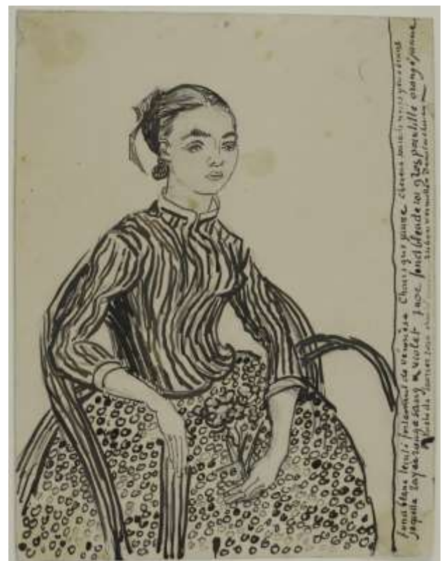
Винсент Ван Гог. Портрет молодой девушки. 1888г.